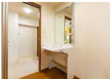
車椅子でも快適な洗面台