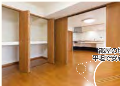
部屋の境も平坦で安心です