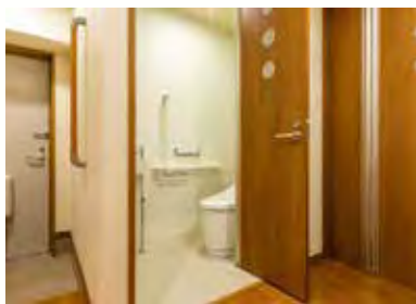
入口も広い、手すり付きのトイレ