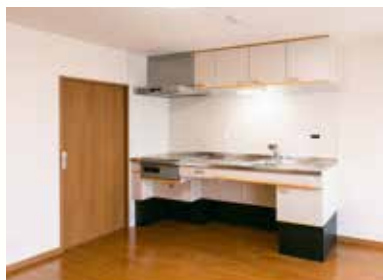
車椅子でも使いやすいキッチン