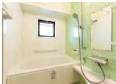
明るく清潔感のあるバスルーム