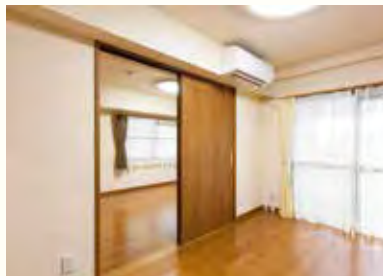
照明器具やエアコンも完備